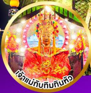
เจ้าแม่ทับทิมกินทิว