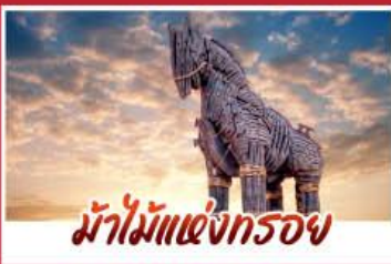
ม้าไม้แห่งกรอย