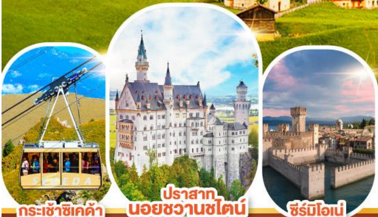
กระเช้าซีเคด้า