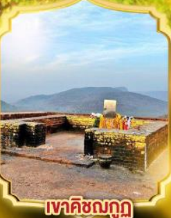
เวทศิขณภู