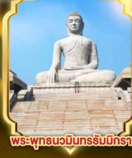
พระพุทธรูปมิ่งมงคล