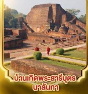
บ้านเกิดพระสารีบุตร นาลันทา