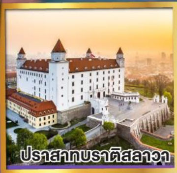
ปราสาทบราติสลาวา