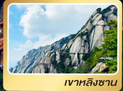
เงาหลิงซาน