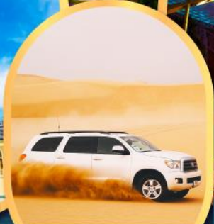
นั่งรถ 4WD ตะลุยทะเลทราย