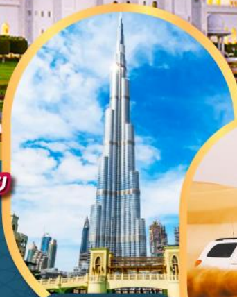
ตึกเบิร์จ คาลิฟา