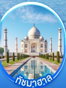
ทัชมาฮาล