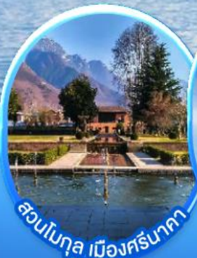
สวนใบกุส เมืองศรีนาคา