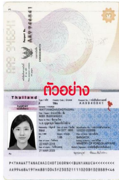
ตัวอย่าง สำเนาหน้าพาสปอร์ต หน้าเต็ม 2 หน้า