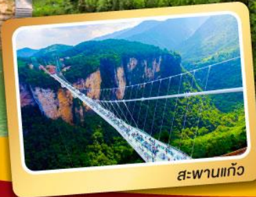
สะพานแก้ว