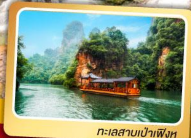
ทะเลสาบเป่าเฟิงหู