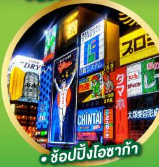
• ช้อปปิ้งโอซาก้า

• ชมความงามของกำแพงหิมะ เส้นทางสายอัลไพน์ทาเคยาม่า (Japan Alps Snow wall)