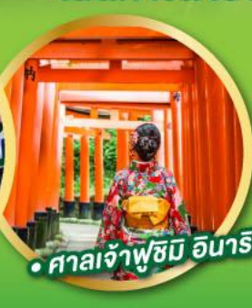
• ศาลเจ้าฟูชิมิ อินาริ