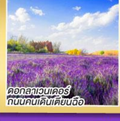
ดอกลาเวนเดอร์ ถนนคนเดินเตียนฉือ