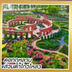
ดอกกุหลาบ สวนต้าโก้วไหลว