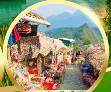
หมู่บ้านก๊ตก๊ต