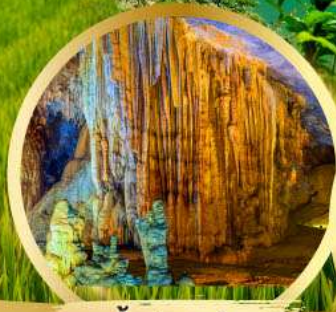
ถ้ำสวรรค์