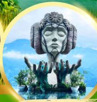
โมนาน่า ซาปา คาเฟ่