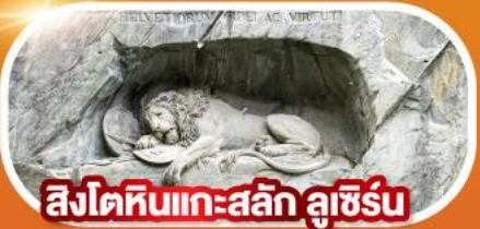
สิงโตหินแกะสลัก ลูซิร์น