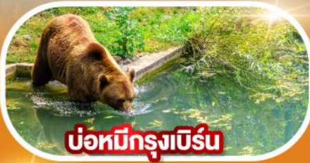
บ่อน้ำกรุงเบิร์น