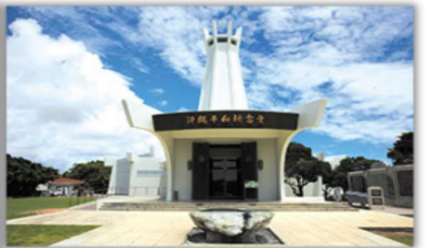
สวนสันติภาพ

สวนสันติภาพ อนุสาวรีย์ที่เป็นสัญลักษณ์ของการสันติภาพ ซึ่งตั้งอยู่ท่ามกลาง สวนสาธารณะ และอุทยาน สวนมีทางล้อมรอบโดยเสาอุปราศที่ออกแบบมาเป็นสัญลักษณ์ ของความสันติภาพ เป็นอนุสรณ์เพื่อรำลึกถึงผู้ที่เสียชีวิตในสมรภูมิตะโอกินาว่าในช่วงสงครามโลกครั้งที่ 2 ซึ่งเป็นหนึ่งในสมรภูมิที่นองเลือดที่สุดในสงคราม