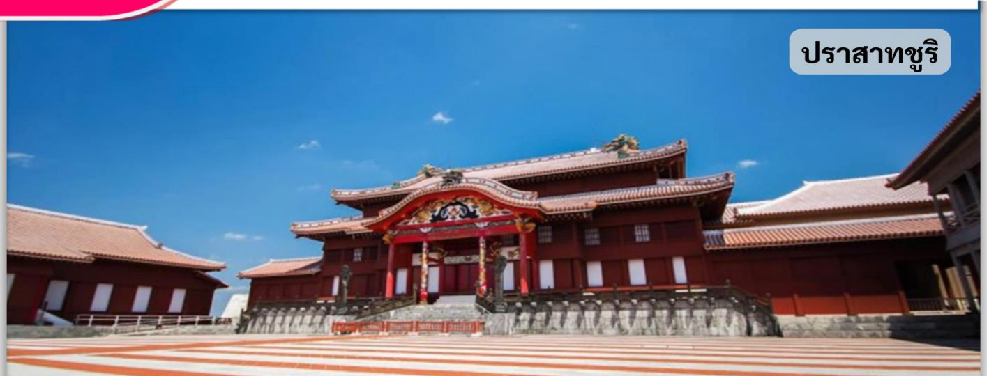
ปราสาทชูริ

เช้า พร้อมกันที่จุดนัดหมาย โดยมีรถบัสให้บริการ