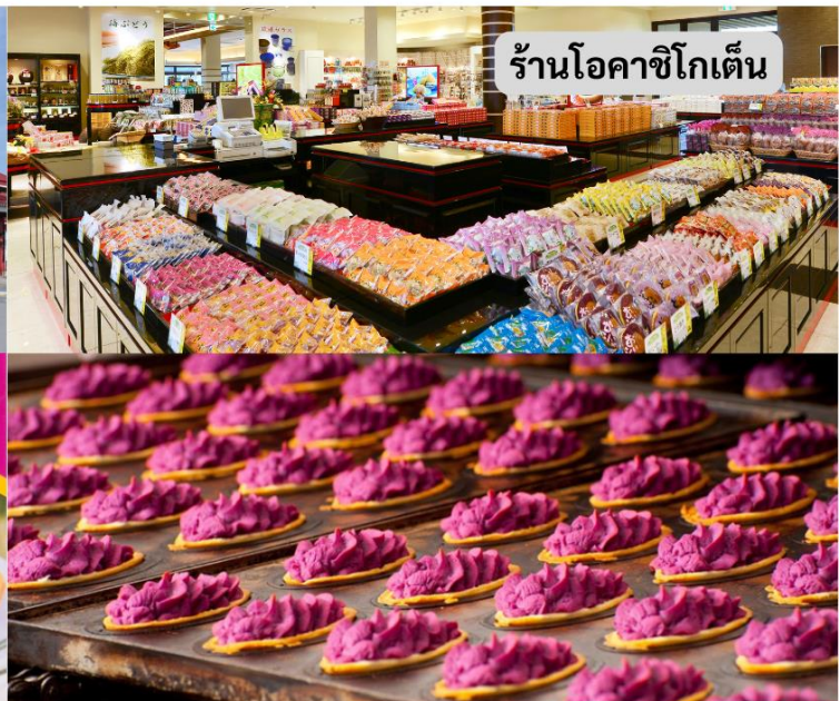
ร้านโอคาชิโกเต็น

อิสระช้อปปิ้ง ร้านโอคาชิโกเต็น ร้านขนมขึ้นชื่อของเมืองโอกินาวา อาทิเช่น ทาร์ตมันม่วง ที่มี คุณภาพและเป็นที่ยอมรับ คุณสามารเลือกของที่ระลึกต่างๆ และขนมขึ้นชื่อของโอกินาวาได้ที่นี้ เย็น เดินทางกลับสู่ที่พัก โรงแรม HOTEL SUN OKINAWA หรือเทียบเท่า