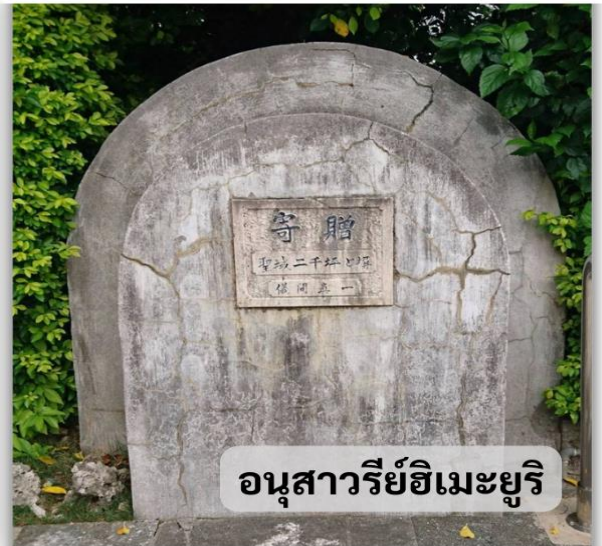
อนุสาวรีย์ฮิเมะยูริ

อนุสาวรีย์ฮิเมะยูริ ที่สร้างขึ้นเพื่อรำลึกถึงดวงวิญญาณของเหล่านักเรียนหญิงฮิเมะยูริที่ได้เสียชีวิตในสงครามโอกินาว่าในปี 1945 และปี 1989 โดยนักเรียนฮิเมะยูริคือนักเรียนหญิงมัธยมปลายและครูที่ได้เข้าไปมีส่วนร่วมในสงครามโอกินาว่าเพื่อดูแลผู้ป่วยขนาน้ำและอาหารให้กับกองทัพก่อนที่จะเสียชีวิตลงจากลูกหลงของการสู้รบที่รุนแรงขึ้น