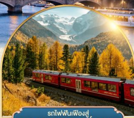
รถไฟฟันเฟืองสู่ ยอดเขากรอนเนอร์เกรต