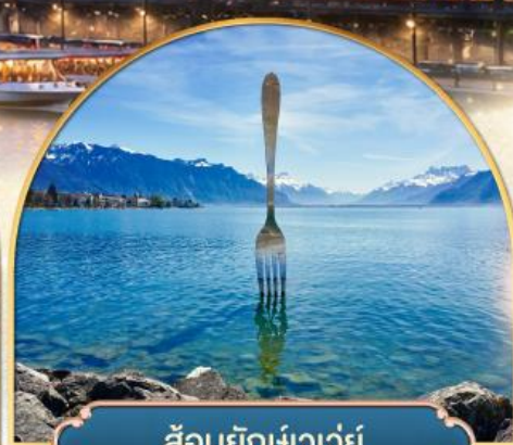
ล้อมยักษ์เวว้ย