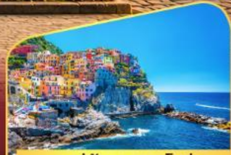
หมู่บ้านมานาโรล่า