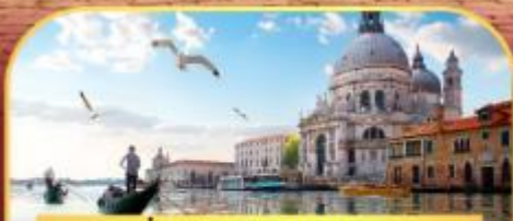
นั่งเรือสุทเกาะเวนิส