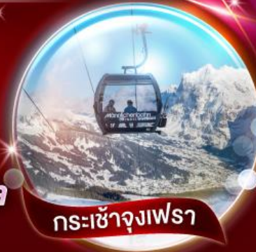
กระเช้าจุงเฟรา

มือพิเศษ รับประทานอาหารบนหอไอเฟล ★★ ชมวิวสุดตะลึงของกรุงปารีส ★★