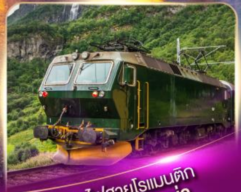
รถไฟสายโรเมนติก ฟลัมส์บาน่า