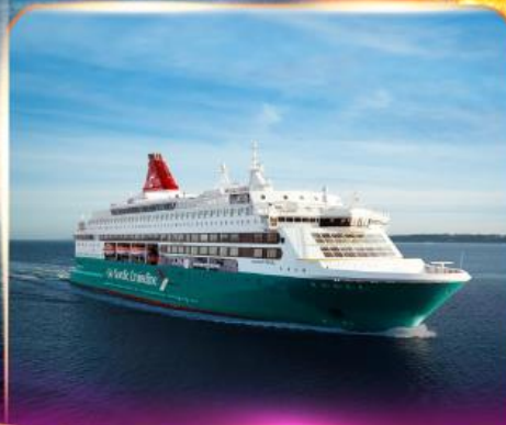
เรือสำราญ GO NORDIC CRUISE LINE