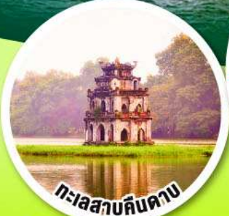
ทะเลสาบคินคาบ