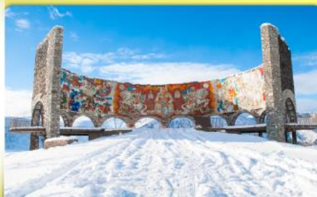
อนุสรณ์สถานรัสเซีย