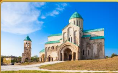
มหาวิหารบากราติ