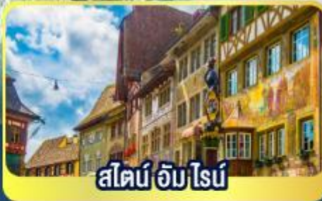
สไตน์ อัม ไนน์