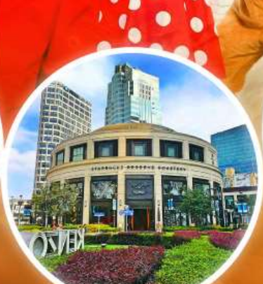
Starbucks ใหญ่ที่สุดในโลก