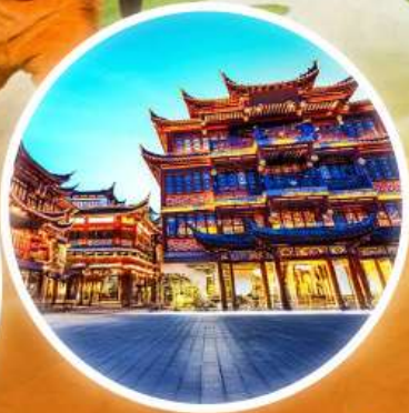
ตลาดร้อยปีเจิ้งหังเมี่ยว