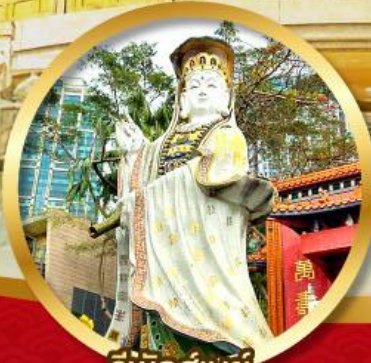
รัฟส์เบย์