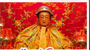
วัดเล่งจื๊อ