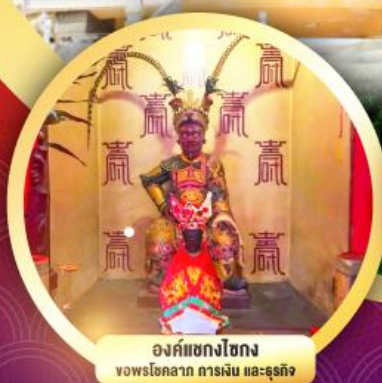
องค์แห่งโชก ของพรโชคลาก การเงิน และธุรกิจ