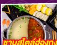
ซาบุดีล้อฮ่องกง