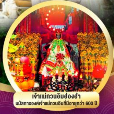
เจ้าแม่กวนอิมอ่องซ่า นับถือองค์เจ้าแม่กวนอิมที่มีอายุกว่า 600 ปี