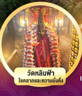
วัดหลินฟ้า โชคลากและความมั่งคั่ง