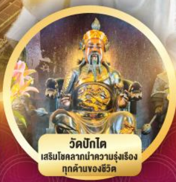
วัดบิกโต เสริมโชคลากนำความรุ่งเรือง ทุกด้านของชีวิต