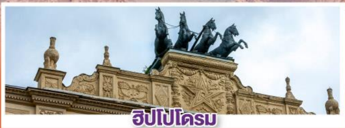
ฮิปโปโดรม