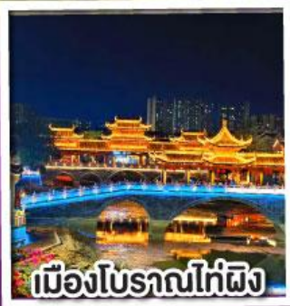
เมืองโบราณไท่ผิง