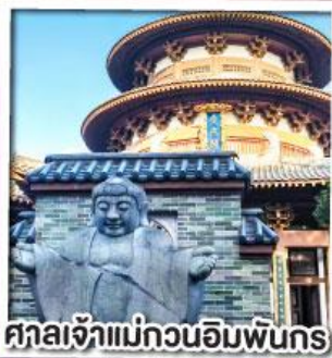
ศาลเจ้าแม่กวนอิมพันกร