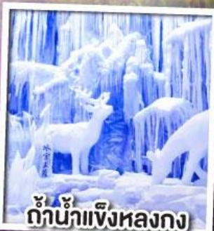
ถ้ำน้ำแข็งหลงกง