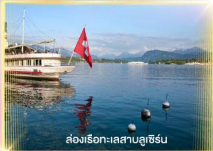
ล่องเรือทะเลสาบลูซิิร์น