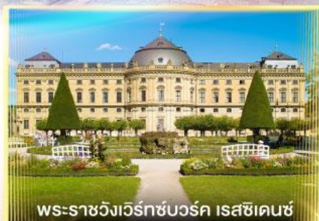
พระราชวังเวิร์ทซ์บวร์ค เรสซิเดนซ์