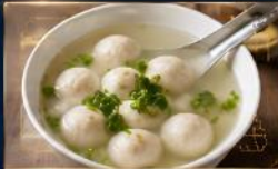
ลูกชิ้นปลา เนื้อแน่น สดใหม่ น้ำซุปรหอมอร่อย