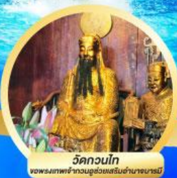
วัดกวนโก พระมหาโพธิ์ท้าวอู่ทองเสด็จข้ามมาบารมี