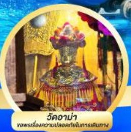
วัดอานำ พระเรื่องความปองอมรย์ในการเดินทาง