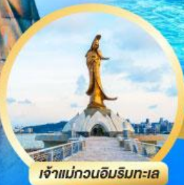
เจ้าแม่กวนอิมธิดะโลก