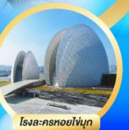
โรงละครหยอโขงนุก