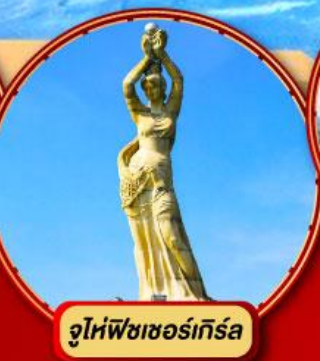
จูไห่พีชเชอร์เกิร์ล