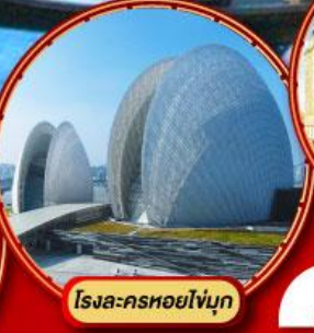
โรงละครหยกไข่มุก