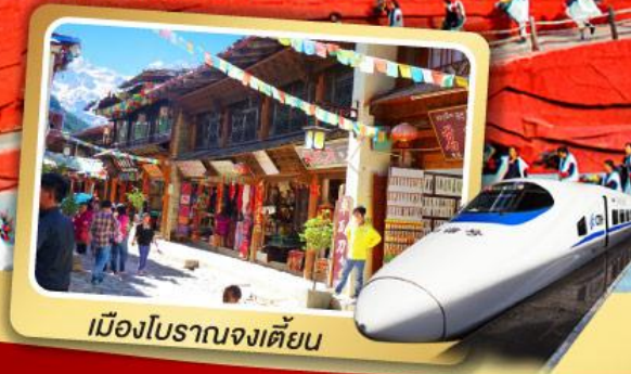
เมืองโบราณจงเตี้ยน