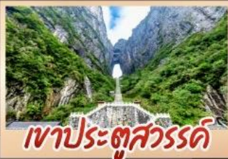
เขาประตูลสวรรค์