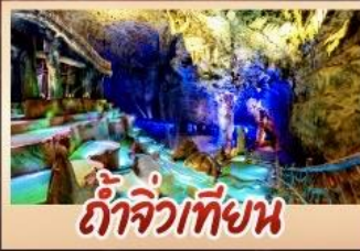
ถ้ำจิวเทียน