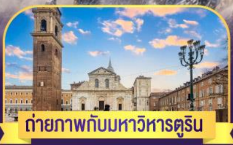
ถ่ายภาพกับมหาวิหารตูริน