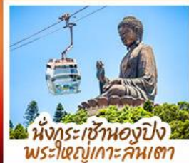
นั่งกระเช้าของปิง พระใหญ่เกาะคันทา