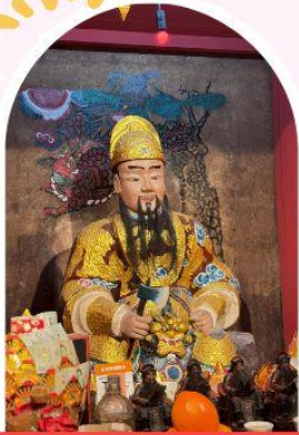
วัดเซกกองเก่าแก่ 600 ปี หยุนหลง

"ไหว้พระ เสริมดวง เพิ่มสิริมงคลแก่ชีวิต"