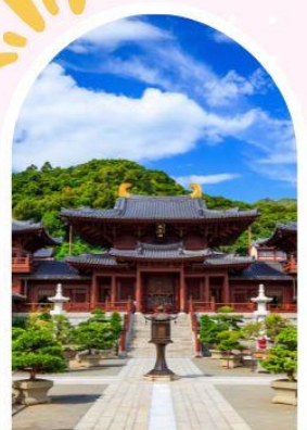
วัดนางชีฉีหลิน สวนหนานเหลียน