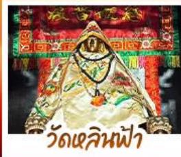
วัดเสลินฟ้า