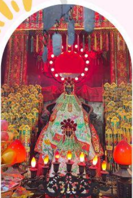
วัดเจ้าแม่กวนอิมอ่องอ่า ขอพรเรื่องเงิน ทรัพย์สิน และความมั่งคั่ง