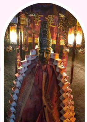
วัดหลินฟ้า โชคลากและความมั่งคั่ง