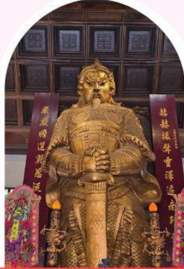
วัดเซก ซาถีน ขอพรโชคลาก การเงิน และธุรกิจ