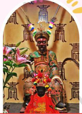
วัดเซกกองเก่าแก่ 400 ปี ไซกง