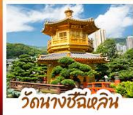
วัดนางชีฉีเสลิน