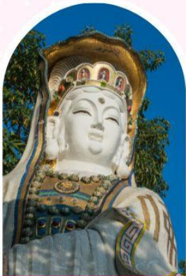
ริพลัสเบย์ รับพลังงานดี เสริมพลังอวัยวะ