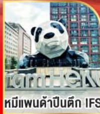
หมีแพนด้าปิ่นดิง IFS