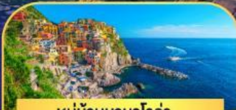
หมู่บ้านมานาโรซ่า