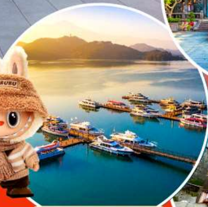
ทะเลสาบสุริยขึ้นจันทรา