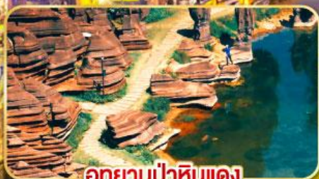
อุทยานป่าหินแดง