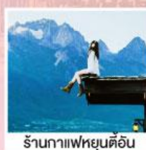
ร้านกาแฟหยุนต้ออัน