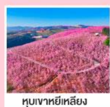
หุบเขาหยี่เหลียง