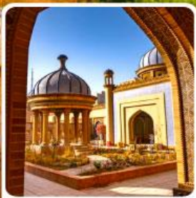
เมืองโบราณซาเซ่อ