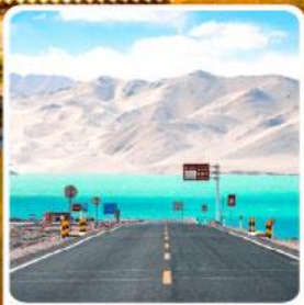
ทะเลสาบเป้ซาหู