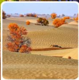
ทะเลทรายทากลามากัน