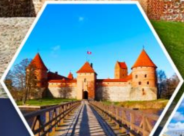
ปราสาททราโต