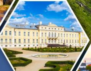
พระราชวังรินดาเล