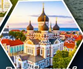
วิหารอเล็กซานเดอร์ นอฟสกี (ทาลลินน์)

• ล่องเรือซิลเซียไลน์ข้าม จากเอสโทเนียสู่ฟินแลนด์ • เข้าชมโบสถ์หิน Rock Church