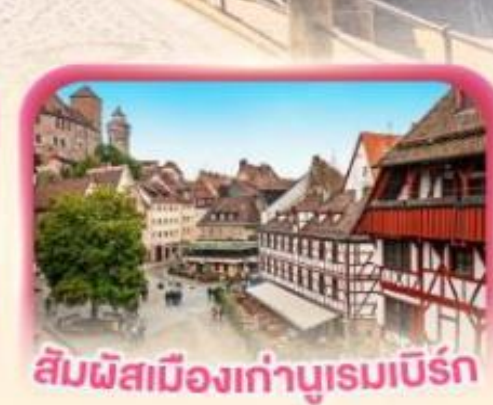
สี่มุมเมืองเก่าบูร์ก