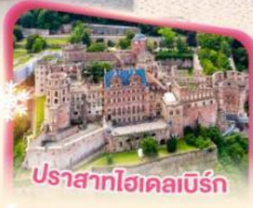
ปราสาทไฮเคลเบิร์ก