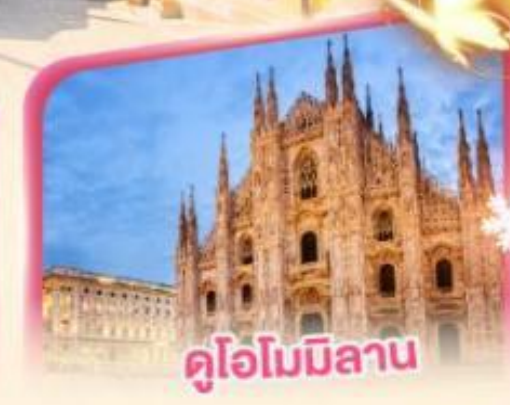
คูโอโมมิลาน