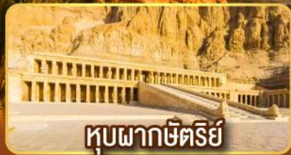
หุบผากษัตริย์