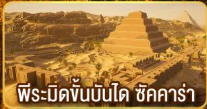
พีระมิดขั้นบันได ชิคคาร์่า