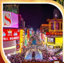
ถนนคนเดิน หวงซิงลู่