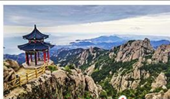
ภูเขาเลาซาน