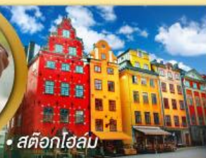
• สต็อกโฮล์ม