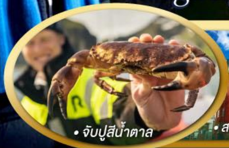
• จับปูสีน้ำตาล