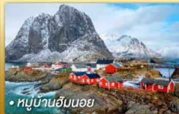
• หมู่บ้านฮันนอย