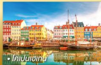
• โคเปนเฮเกน