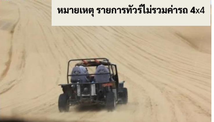
หมายเหตุ รายการทัวร์ไม่รวมค่ารถ 4x4

กลางวัน รับประทานอาหารกลางวัน ณ ภัตตาคาร (เมื่อที่ 8)