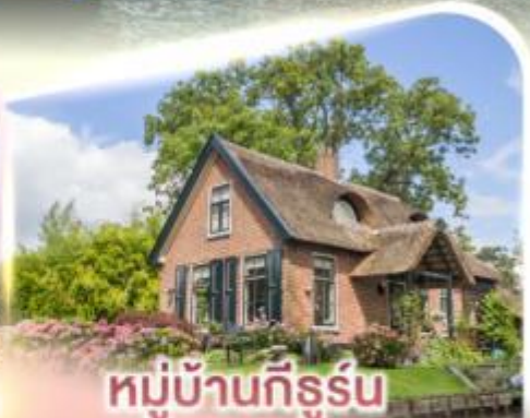
หมู่บ้านทีร์น