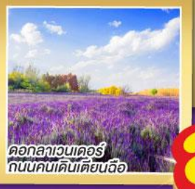
ดอกลาเวนเดอร์ ถนนคนเดินเตียนอ้อ