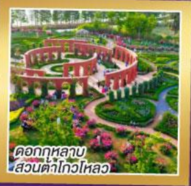
ดอกกุหลาบ สวนต้าโกวหลิว